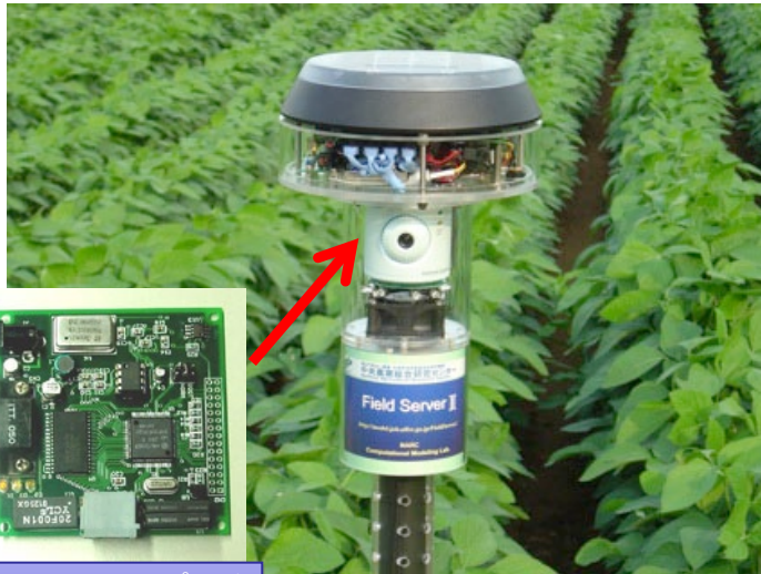
OS15Sワンチップマイコン